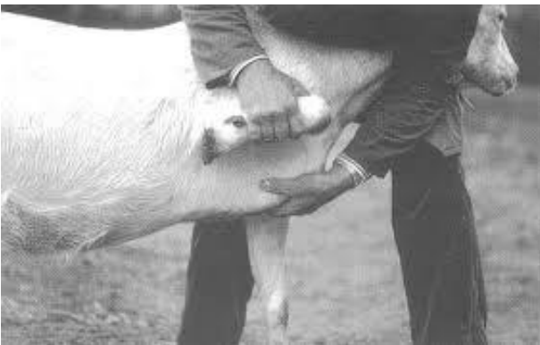
Valutazione della zona sternale

Nella tabella sottostante (fonte: SATA) vengono riportati i punteggi ideali che dovrebbero avere gli animali nei diversi momenti produttivi.